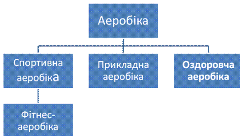
Рис. 4. Класифікація напрямків аеробіки

Структура занять з аеробіки має розгалужену та ступеневу систему, де кожний з виділених самостійних напрямків аеробіки поділяється на певні різновиди (рис. 4).