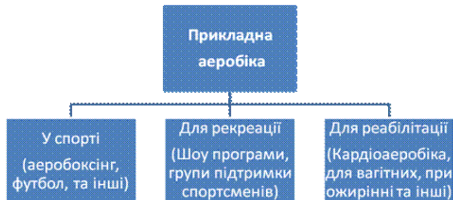
Рис. 5. Класифікація напрямків прикладної аеробіки

Прикладна аеробіка була створена на основі оздоровчої аеробіки, її популярність зростає з кожним днем, та має поле для більш детальних наукових досліджень. Застосування прикладної аеробіки знаходить своє місце як базове тренування майже для всіх видів спорту, широко використовується в показових виступах та шоу-програмах (рис. 5).