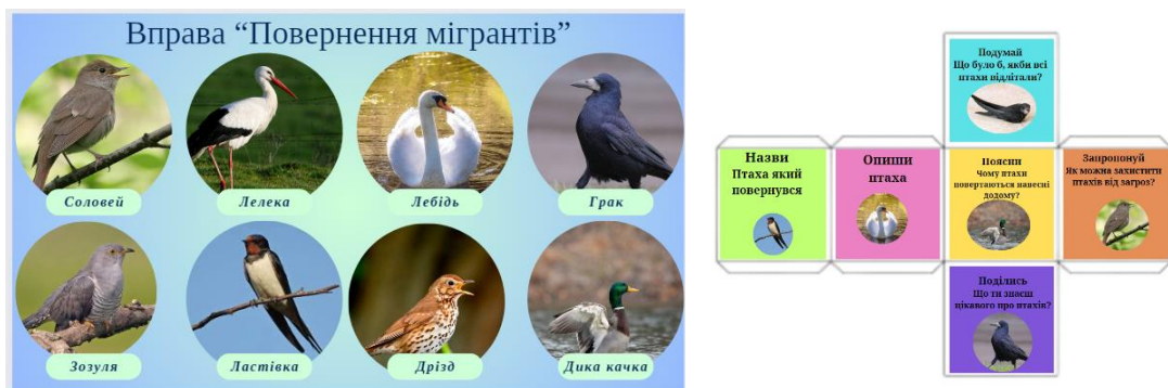
Рис. 2. Приклад реалізації методу «Кубик Блума» під час вивчення теми «Тварини навесні» (2 клас)

На етапі узагальнення та систематизації знань, умінь і навичок під час вивчення теми «Тварини навесні» (2 клас) доцільно реалізувати інтерактивний метод «Мікрофон». На екрані виводяться питання, учителем обирається перший учень, який одержує уявний «мікрофон», після надання відповіді учень називає ім'я свого однокласника, якому передає слово, так відбувається допоки всі питання не закінчаться (рис. 3).