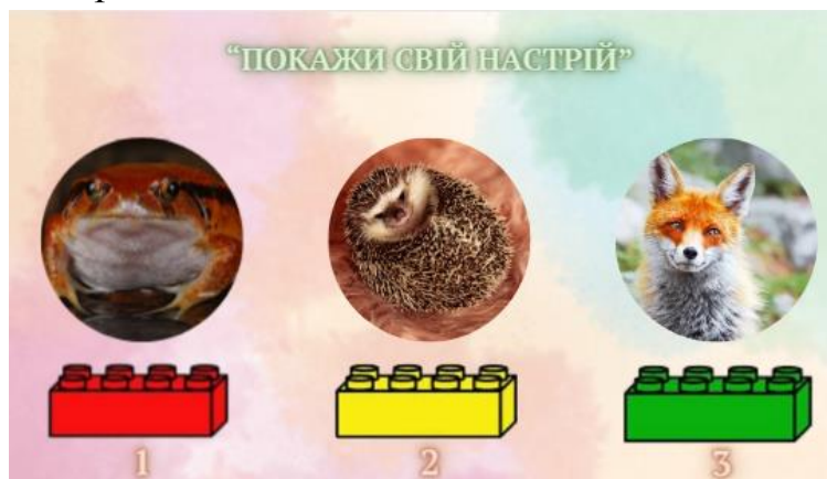
Рис. 4. Приклад реалізації LEGO-технології під час вивчення теми «Тварини навесні» (2 клас)

Організуючи роботу з цеглинками LEGO для того щоб, учні мали змогу показати, як вони засвоїли навчальний матеріал, і який настрій вони мають наприкінці уроку, учитель просить здобувачів початкової освіти заздалегідь підготували три цеглинки: червоного, зеленого та жовтого кольору. На екрані демонструється три тварини і під кожним фото є певний колір цеглинки (рис. 4). Учні мають піднести до камери саме той колір, який відповідає їхньому настрою.