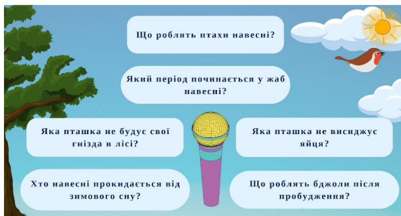
Рис. 3. Приклад реалізації методу «Мікрофон» під час вивчення теми «Тварини навесні» (2 клас)

На етапі узагальнення та систематизації знань, умінь і навичок під час вивчення теми «Тварини навесні» (2 клас) доцільно реалізувати інтерактивний метод «Мікрофон». На екрані виводяться питання, учителем обирається перший учень, який одержує уявний «мікрофон», після надання відповіді учень називає ім'я свого однокласника, якому передає слово, так відбувається допоки всі питання не закінчаться (рис. 3).