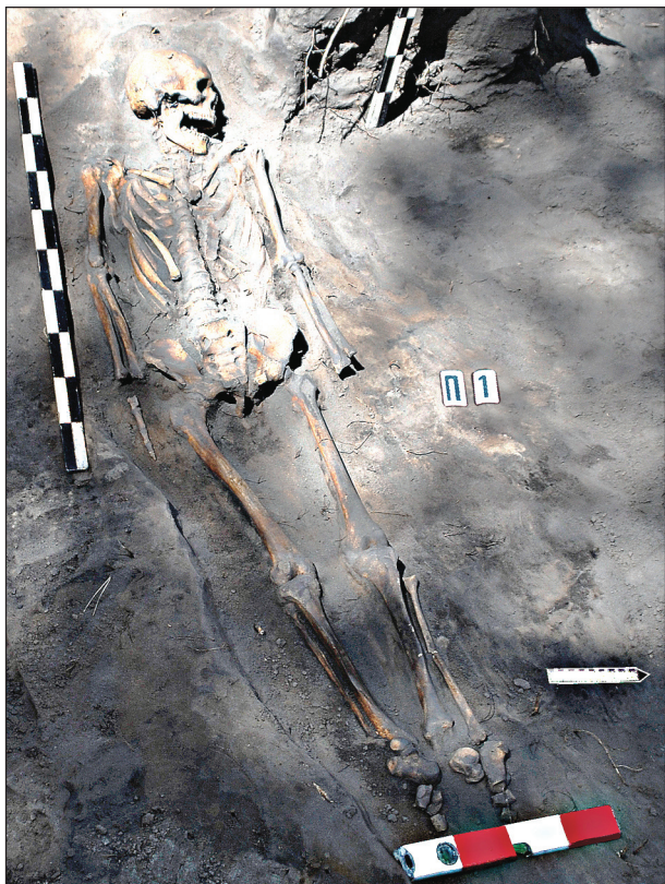
Рис. 1. Середньовічне поховання в селищі Кицівка 1, вид зі сходу

Поховання з аналогічними характеристиками добре відомі в середовищі кочового населення огузо-печенізького кола (кінець IX — XI ст.) і характерні, на думку Г. О. Федорова-Давидова, для чорних клобуків. Згідно з класифікацією дослідника поховання з поселення Кицівка 1 можна зарахувати до