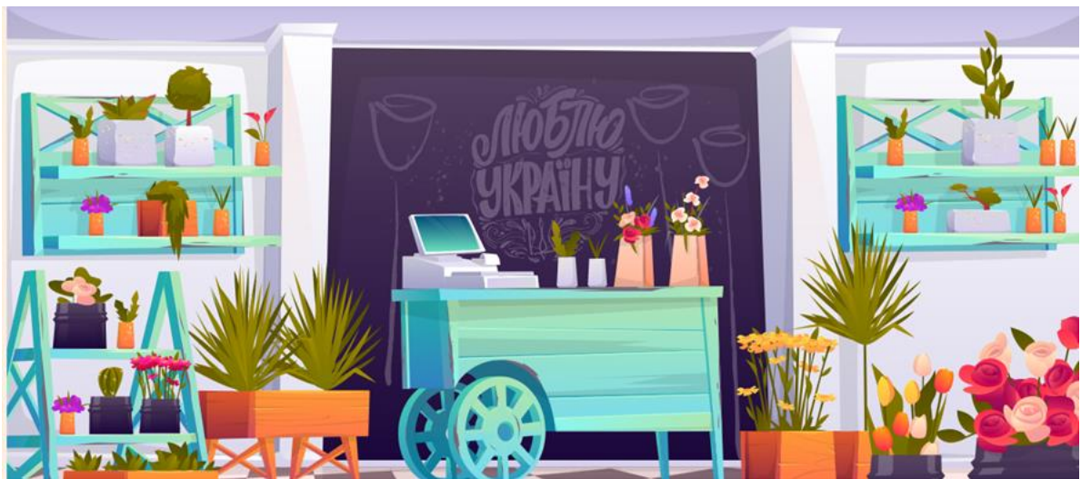
Рис.1 Загальний дизайн веб-квесту «У квітковому магазині»

На першому етапі створення вебквесту, нами було визначено тему, обрано загальний дизайн вебквесту (рис. 1), описано вступне слово та покрокову інструкцію для учнів щодо його проходження.