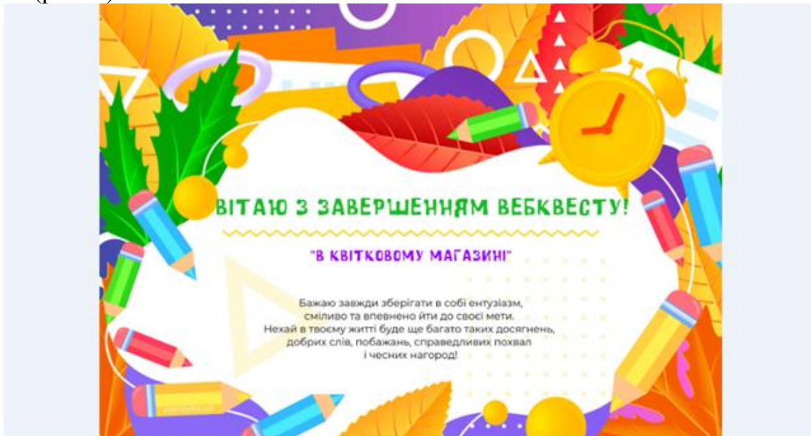
Рис. 4. Шаблон сертифіката учасника вебквесту «У квітковому магазині»

Після завершення проходження вебквесту, учні отримують сертифікат учасника (рис. 4).