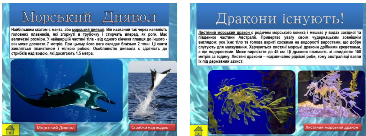
Рисунок 4. Приклади слайдів інтерактивної презентації до теми «Таємниці підводного світу» (4 клас)

Отже, ретельний добір природничої, суспільно-історичної інформації, її візуалізація у вигляді інтерактивних презентацій та представлення у вигляді тематичних рубрик посприяє ефективній інтеграції змісту громадянської та історичної освітньої галузі в курсі «Я досліджую світ», досягненню мети та завдань, визначених Державним стандартом початкової освіти та Типових освітніх програм, і як результат – формування особистості здобувача початкової освіти як відповідального громадянина держави.