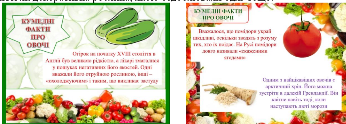
Рисунок 1. Приклади слайдів інтерактивної презентації до рубрики «Кумедні факти про овочі» (1 клас)

Зокрема, при вивченні теми «Дикорослі та культурні рослини» у 1 класі пізнавальною та незвичайно цікавою є історична інформація з рубрики «Кумедні факти про овочі», що представлено в Рис. 1. У рубриці пропонуємо інформацію про те, що: першим законсервованим овочем був саме горошок; буряк раніше використовували як дезінфікуючий засіб; у Європі картопля з'явилася у 17 столітті як декоративна рослина, якою оздоблювали одяг тощо.