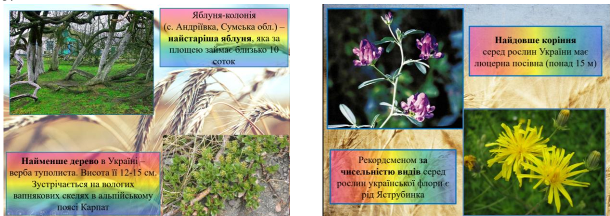
Рисунок 3. Приклади слайдів інтерактивної презентації до рубрики «Рослини-рекордсмени України» (3 клас)

Під час вивчення теми «Природа голубої планети» (4 клас) інтегрованого курсу «Я досліджую світ» пропонуємо у рубриці «Таємниці підводного світу» ознайомити здобувачів початкової освіти з такими цікавими фактами про мешканців підводного світу: «Тварина, яка бачила динозаврів»; «Драconi існують!», «Велетень океану», «Чарівні рифи», «Морський диявол», «Зірки морської естради» тощо, що висвітлено в Рис. 4.