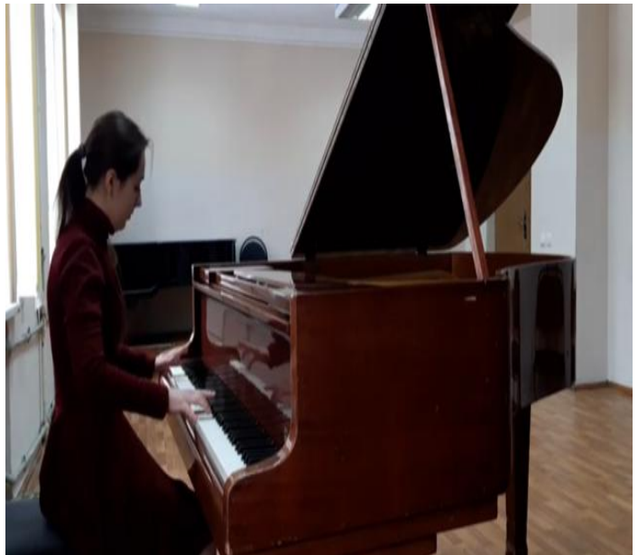
URL : https://youtu.be/_FH3v1V5qb8