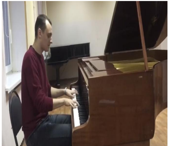
URL : https://youtu.be/eUo7WJK1Dn8