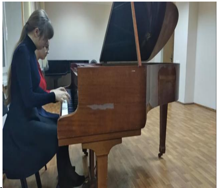
URL : https://youtu.be/u_35WIY1Qeg